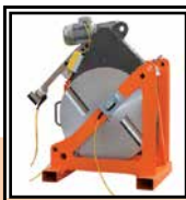
Supporto Fresa Termoelemento