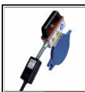
Termoplastra con Digital Dragon