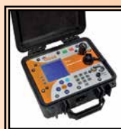
The INSPECTOR Data-logging