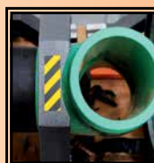
Morse scaricate per curve raccordi