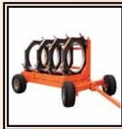
Carro de transporte