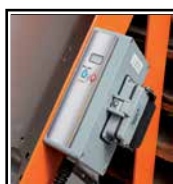
Controlador electrónico "Digital Dragon"