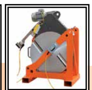
Soporte Placa térmica y Fresadora