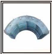
Reducciones Ø 200 ÷ 450 mm