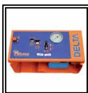
Central óleo dinámica