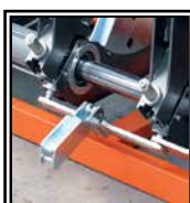
Despegue automático de la placa térmica