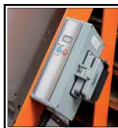
Controlador electrónico "Digital Dragon"