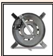
Cuello porta bridas