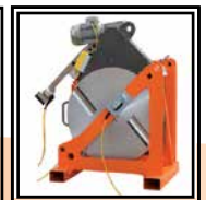
Soporte Placa térmica y Fresadora