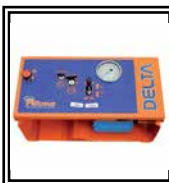
Central óleo dinámica