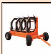
Carro de transporte