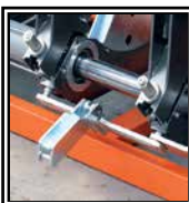
Despegue automático de la placa térmica