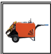
Central óleo dinámica