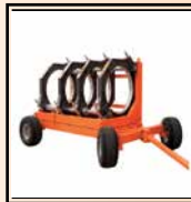
Carro de transporte