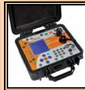
The INSPECTOR Data-logging