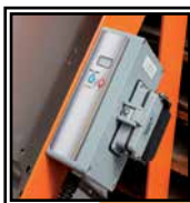
Controlador electrónico "Digital Dragon"