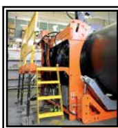
Area di lavoro