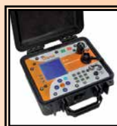
The INSPECTOR Data-logging