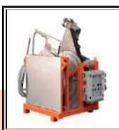
Supporto Fresa Termoplastra