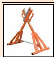
Rodillo HS 250

Y: Reducciones Ø 2" ÷ 8" IPS; 3" ÷ 8" DIPS