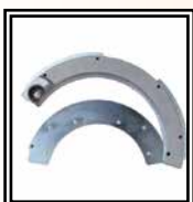
Reducciones Ø 75 ÷ 225 mm