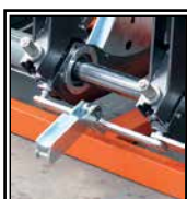
Despegue automático de la placa térmica