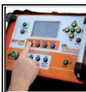
Pannello di controllo con GPS