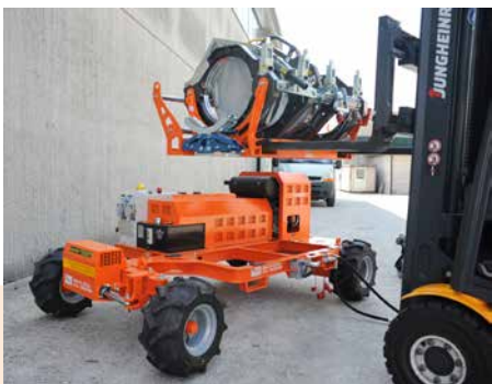
Levantamiento cuerpo alineador