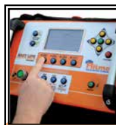
Panel de control con GPS