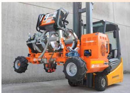
Delta 355 All Terrain levantamiento de la soldadora

DELTA 355 TRAILER no tiene un generador a bordo y necesita de alimentación externa; sin tracción. Sistema de soldadura EASY LIFE.