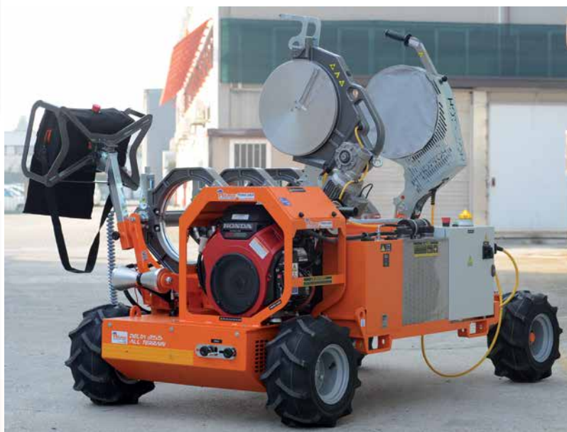
DELTA 355 All Terrain propulsada: motor diesel o motor gasolina