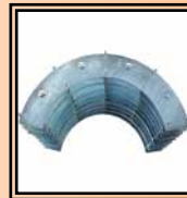
Reducciones Ø 225 ÷ 630 mm