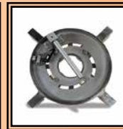
Cuello porta bridas

Y: Reducciones Ø 8" ÷ 24" IPS; 8" ÷ 20" DIPS; KIT trabajo dentro de la cava, HS Roller 630, KIT levantamiento, caja de transporte