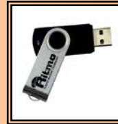
Software Ritmo Transfer