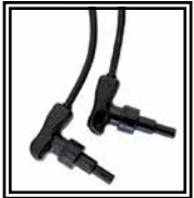
Conectores universal Ø 4.0 - 4.7 mm