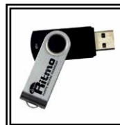
Software Ritmo Transfer