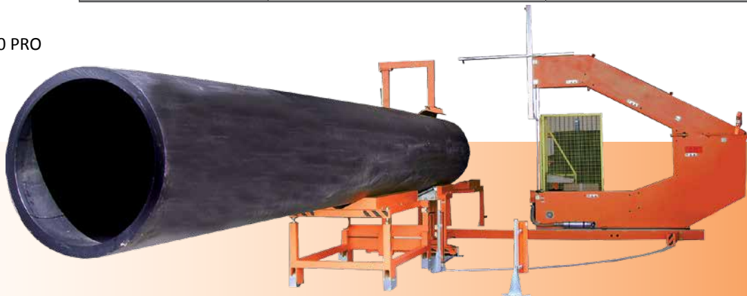
SIGMA 1200 PRO