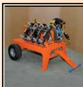
Carro de transporte