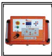
Central óleo dinámica