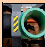
Mordaza rebajada para fijar las distintas geometrías de accesorios