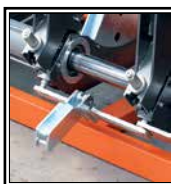
Despegue automático de la placa térmica