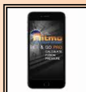
App "Set & Go Pro"