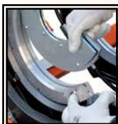
Riduzioni Ø 75 ÷ 225 mm