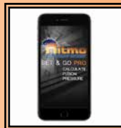
App "Set & Go Pro"