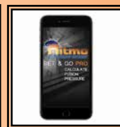
App "Set & Go Pro"