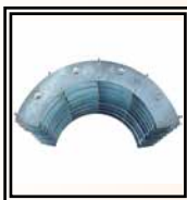
Riduzioni Ø 200 ÷ 450 mm