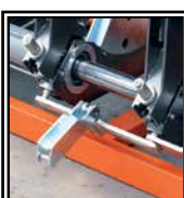
Despegue automático de la placa térmica