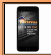
App "Set & Go Pro"