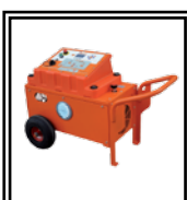
Central óleo dinámica