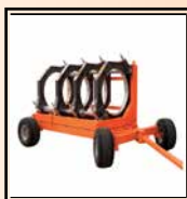
Carro de transporte