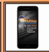
App "Set & Go Pro"