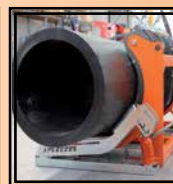
Rulliere laterali idrauliche