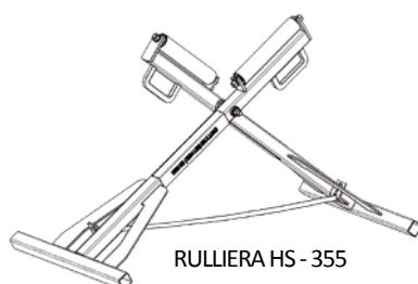
RULLIERA HS - 355