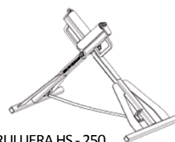
RULLIERA HS - 250