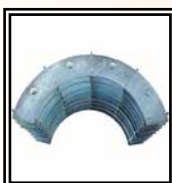
Reducciones Ø355÷900 mm