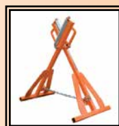
Rodillo HS 1000