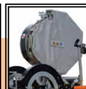
Placa térmica Hidráulica