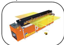
Tipi di saldature

POLYFUSION 4-30 è in grado di operare con lastre poste sia in posizione orizzontale che verticale; ciò permette l'esecuzione di tre diversi tipi di saldatura in piano (con dotazione di serie); 90° e virola (con accessori a richiesta).