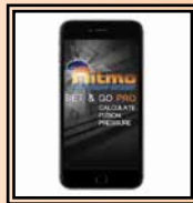
App "Set & Go Pro"

Y: Reducciones Ø 1" ÷ 5" IPS; 3" ÷ 4" DIPS bolsa protectora de la placa