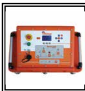
Central óleo dinámica