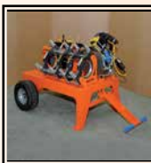
Carro de transporte