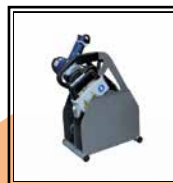
Soporte Placa térmica y Fresadora