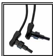
Connettori 90° Universali 4-4,7mm