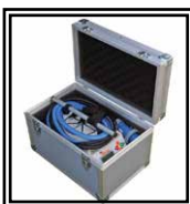
Cassa di Trasporto