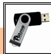
Software Ritmo Transfer