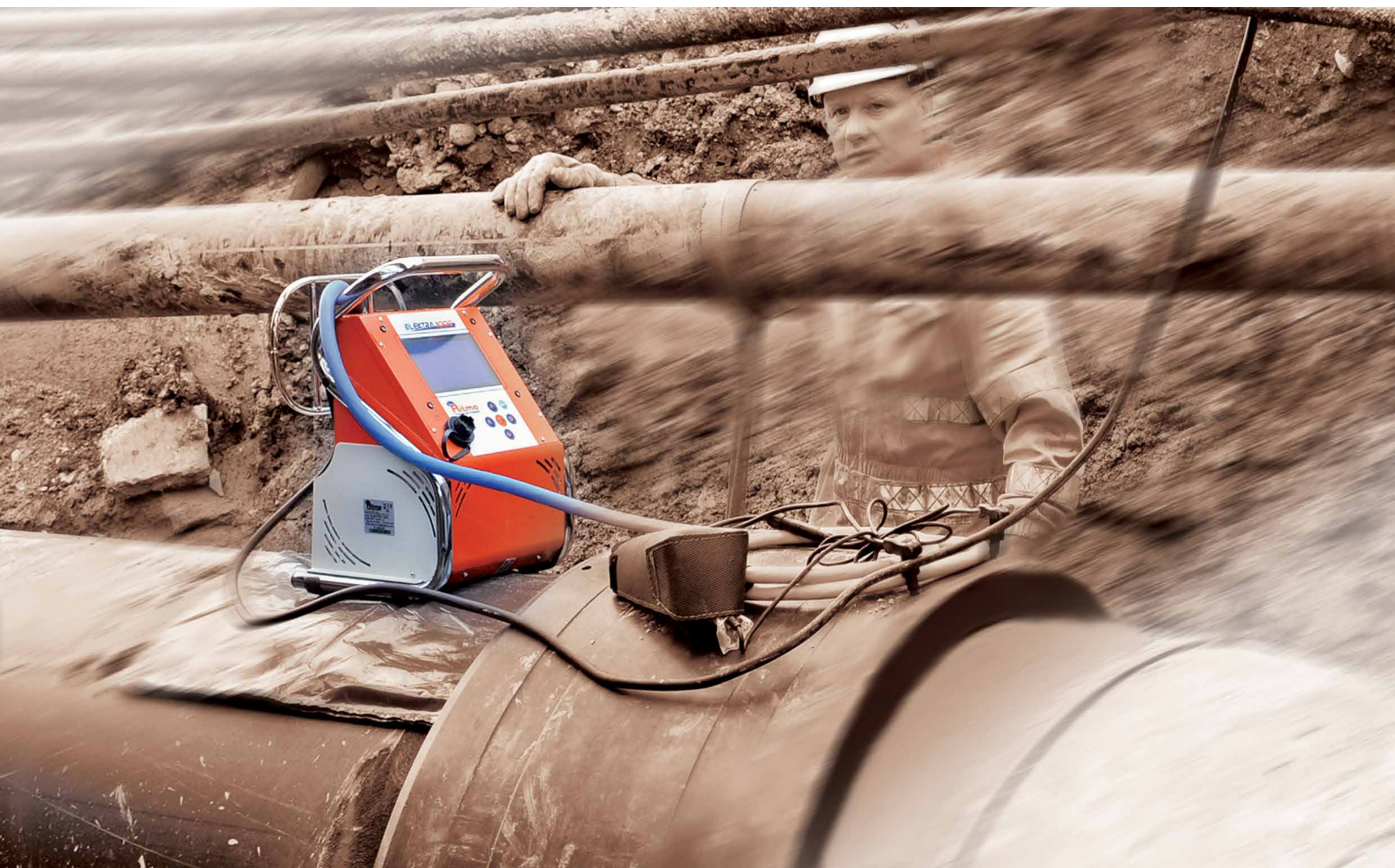
* CAMPO DI LAVORO Ø mm