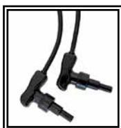
Conectores 90° Universales 4-4,7 mm