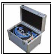
Caja de Transporte